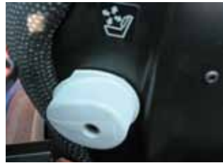
Nur beste Komfortsitze werden verwendet, z.B. mit mehrfach verstellbarer Lendenstütze und Federweg.