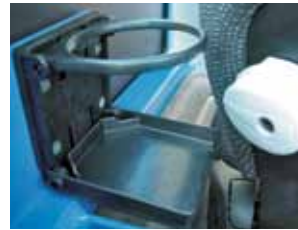
Im Heckbereich steht Ihnen ein Getränkehalter, eine Steckdose für Kühlbox, Radio, Funk u.s.w. und Stauraum für persönliche Utensilien zur Verfügung.