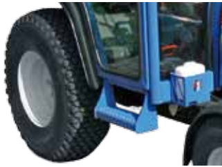
Rutschfester und sicherer Eintritt durch stabilen Fußtritt.