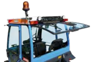
Front-/Heckscheiben können ganz oder nur teilweise (Spalthalter) geöffnet werden.